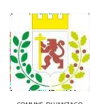
COMUNE DI VANZAGO