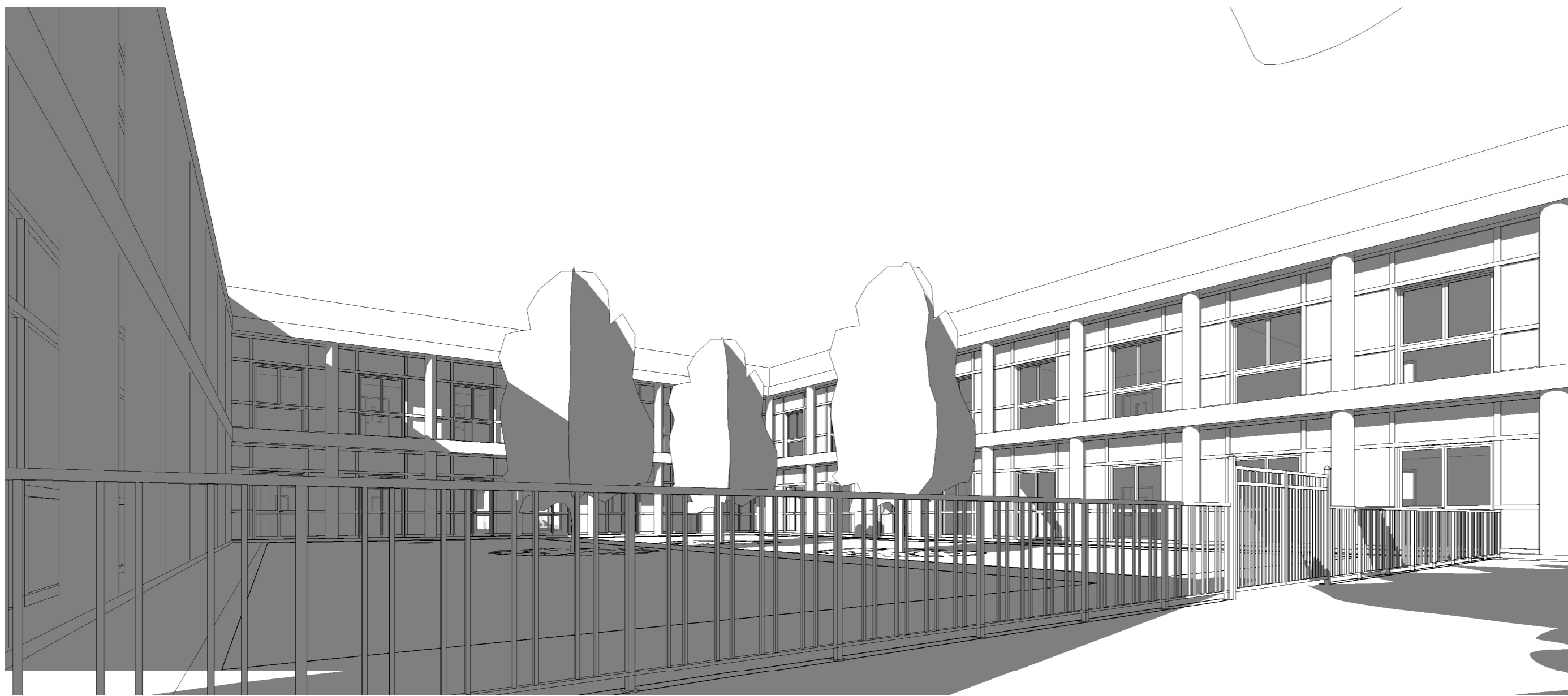
Vista corte edificio A Scala