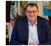
Pietro Romano Sindaco di Rho