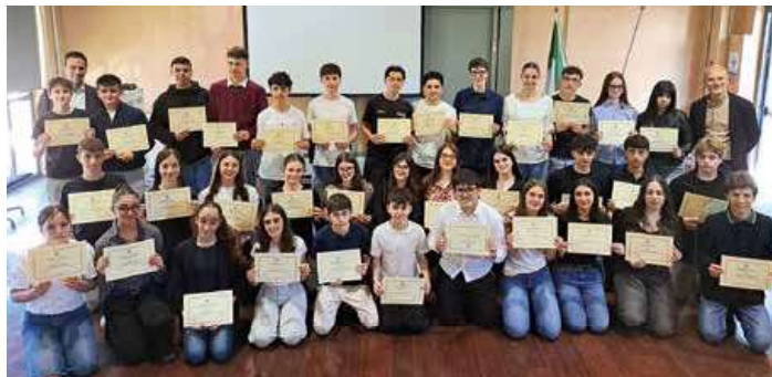
Borse di studio per l'anno 2024-2025: gli studenti che frequentavano le secondarie di primo grado, qui sotto quelli che erano alle superiori

Abbiamo inaugurato il parco di via dei Ronchi con una grande festa che ha coinvolto la scuola dell'infanzia: a San Pietro c'è una comunità educante fatta di mamme, papà, nonni, insegnanti, educatori, stretta intor-