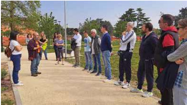
Cittadini di Lucernate e non solo hanno apprezzato il tour scoprendo come si sta trasformando la grande area verde