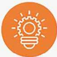
Solidità e Innovazione