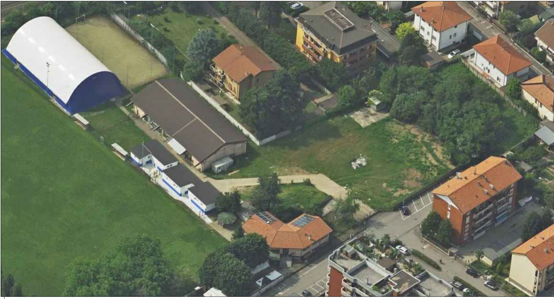
VISTA AEREA DELL'AREA OGGETTO DI INTERVENTO