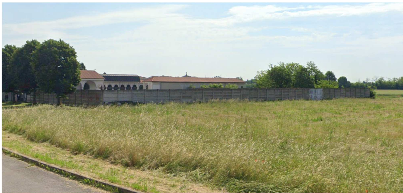
Lato del cimitero dove è previsto l'accesso al cantiere