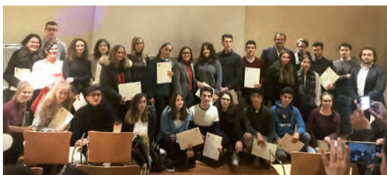
Gli studenti delle secondarie di secondo grado premiati il 20 dicembre 2018

Fino al 28 giugno è possibile presentare le domande per meriti scolastici conseguiti nell'anno scolastico 2017/2018