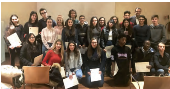
Il gruppo di ragazzi meritevoli delle scuole secondarie di primo grado

Il bando integrale e la domanda di partecipazione sono disponibili allo Sportello del Cittadino - QUIC oppure sul sito internet del Comune www.comune.rho.mi.it .