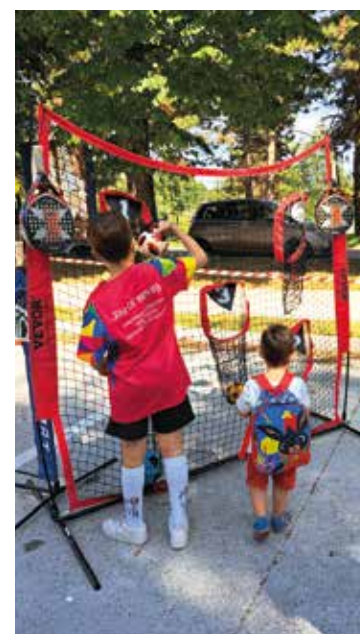
Battute di baseball e prove con il nastro. Sotto, Sindaco Assessore e team dello Sport