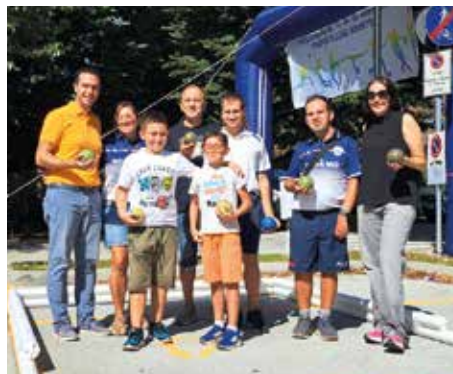
Nel logo il manifesto di nordic walking A sinistra le cheerleaders, qui sopra il gruppo di Sesamo al campo di bocce e a destra le ragazze della Rhodense